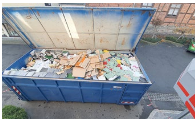
Der Container ist voll. 3.200 Akten wurden zur datenschutz- und datensicherheitsgerechten Vernichtung freigegeben